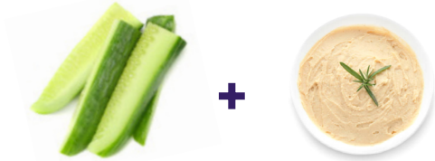
Pepino + hummus

Estas son algunas de las mejores combinaciones para un refrigerio: