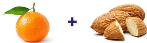
Clementina + almendras