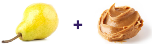
Pera + mantequilla de mani