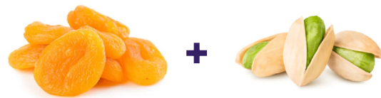
Albaricoques secos + pistachos