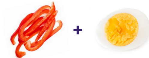
Bastones de pimiento morrón + huevo hervido