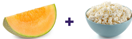
Melon + queso sin sal